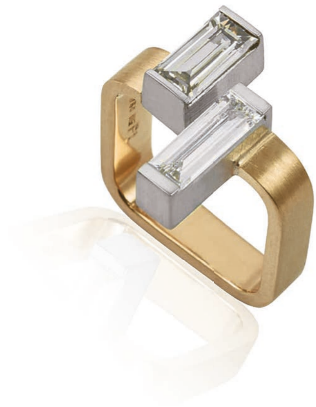
RING 950 Platin & 750 Gelbgold | Diamant 1,00 Carat | Diamant 0,87 Carat