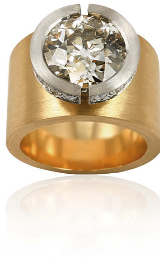
RING 950 Platin & 750 Gelbgold | Brillant 5,41 Carat | 18 Brillanten 0,42 Carat total