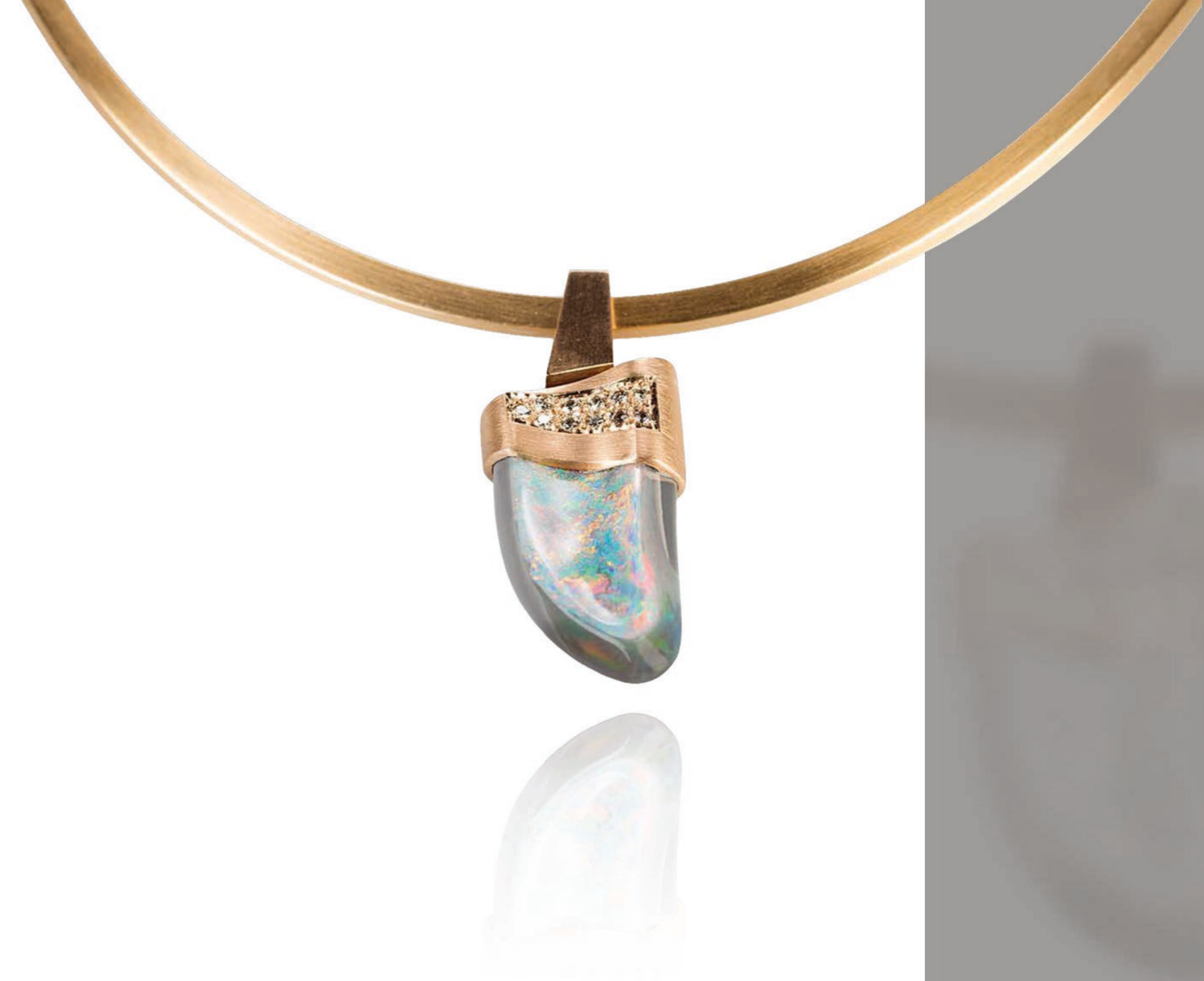
HALSSCHMUCK 750 Rotgold | Black-Opal 18,56 Carat | 11 Brillanten 0,21 Carat total