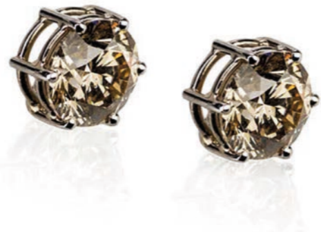
OHRSCHMUCK 750 Weißgold | 2 Brillanten 3,14 Carat total