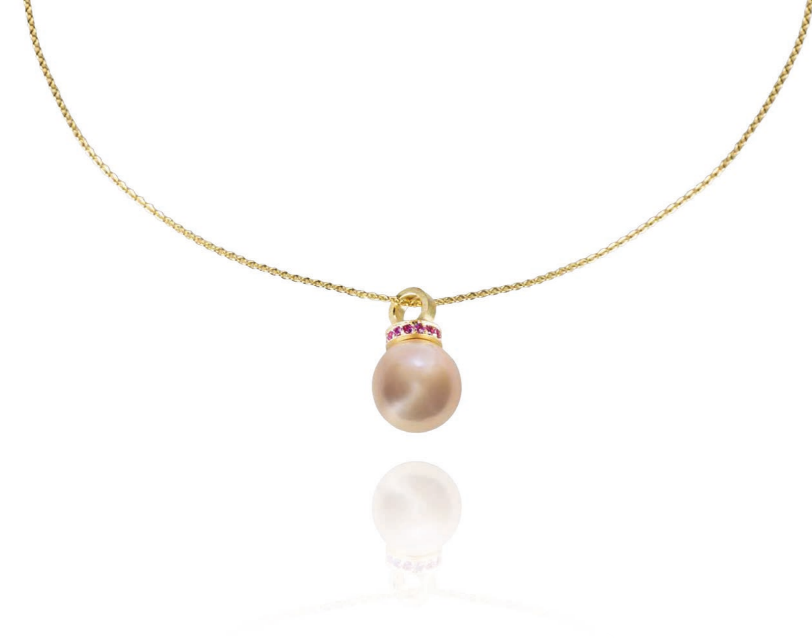
HALSSCHMUCK 750 Gelbgold | Süßwasser-Perl-Tropfen | 11 Pink-Saphire 0,28 Carat total