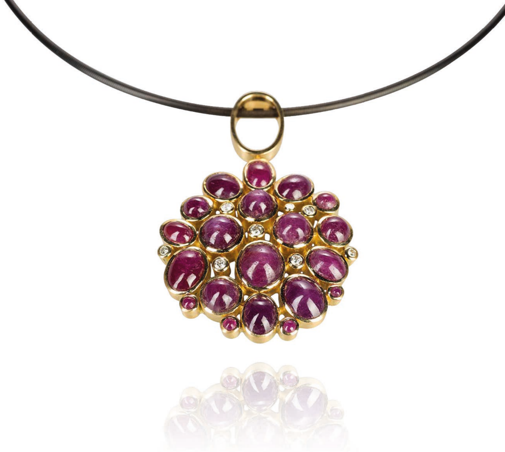
HALSSCHMUCK 750 Gelbgold | Rubine 48,58 Carat total | 8 Brillanten 0,48 Carat total