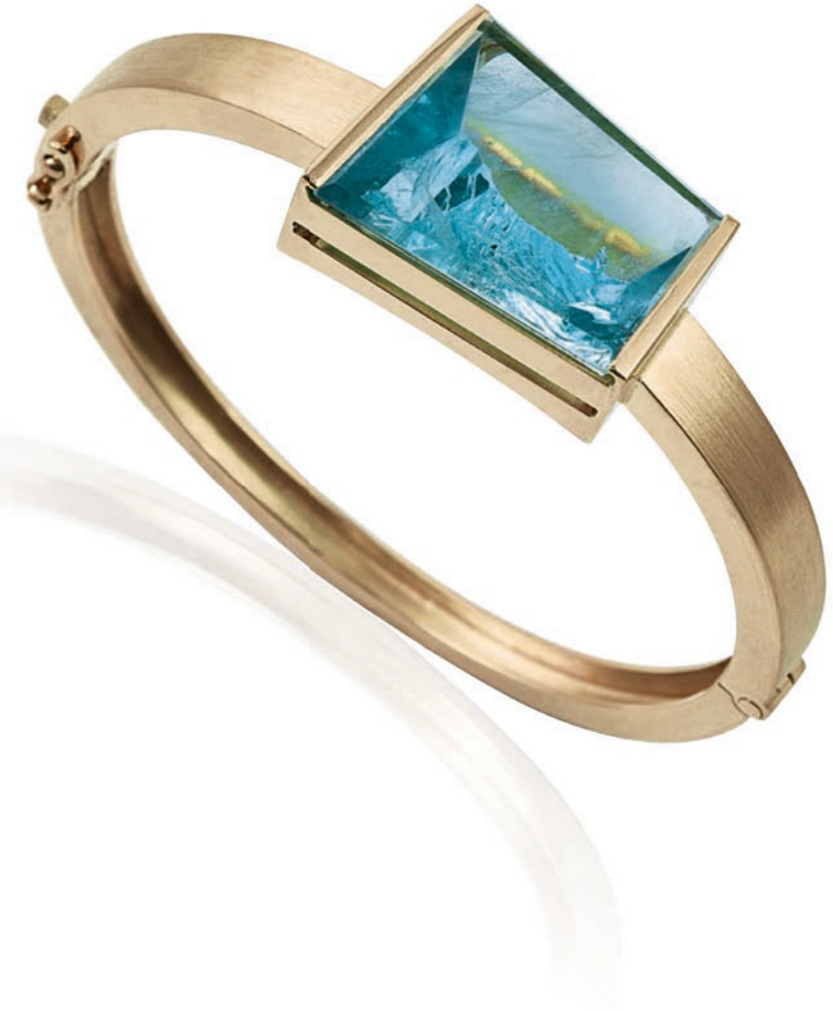
ARMREIF 750 Gelbgold | Aquamarin 26,22 Carat