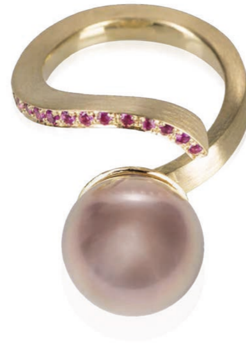
RING 750 Gelbgold | Süßwasser-Perle | 12 Pink-Saphire 0,31 Carat total