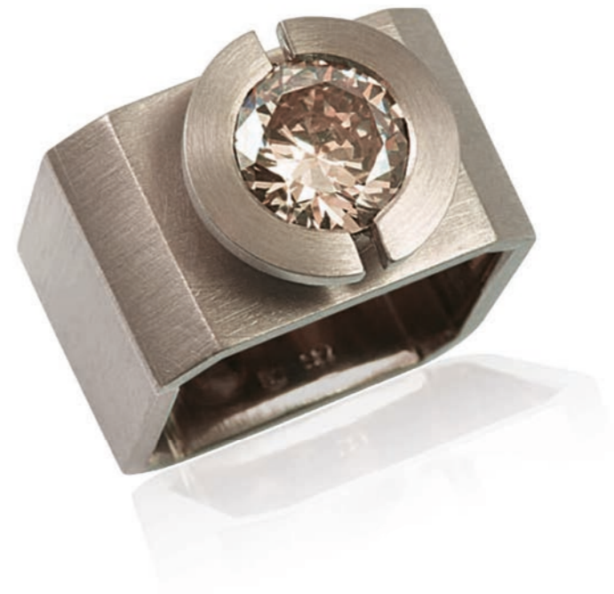
RING 750 Weißgold | Brillant 2,01 Carat