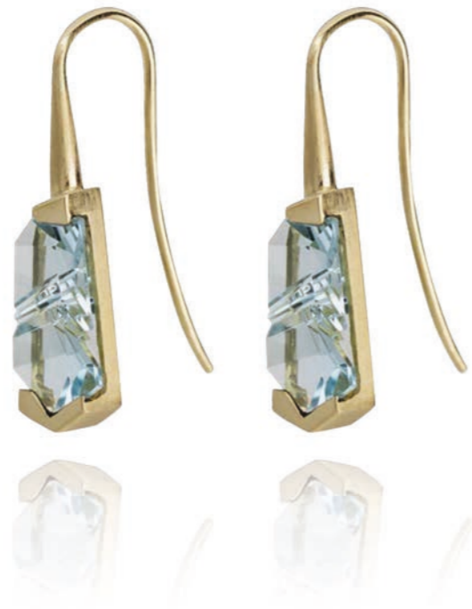
OHRSCHMUCK 750 Gelbgold | 2 Aquamarine 7,27 Carat total