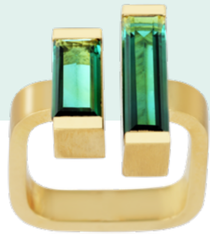
RING 750 Gelbgold | Turmalin-Baguettes 3,55 Carat total