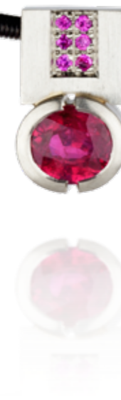
HALSSCHMUCK Platin | Rubin 2,49 Carat | Rosa Sapphire