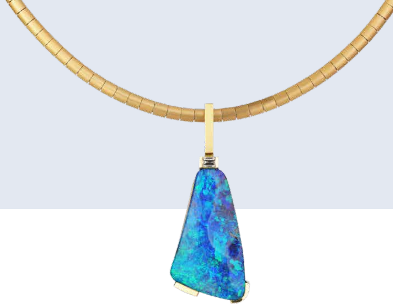
HALSSCHMUCK 750 Gelbgold | Boulder-Opal 48,38 Carat | Diamant-Baguette 0,26 Carat