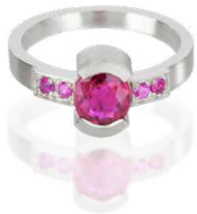
RING Platin | Rubin 1,52 Carat | Rosa Sapphire