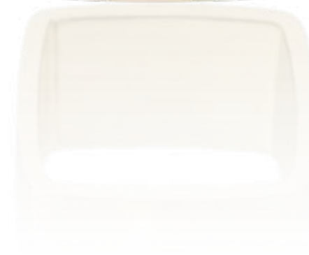
OHRSCHMUCK 750 Gelbgold | Brillanten 1,38 Carat total