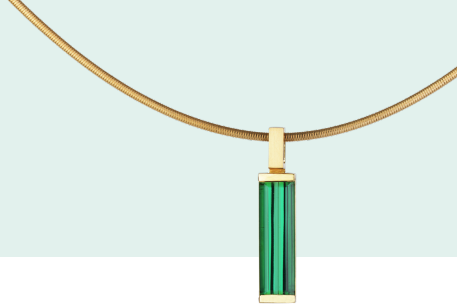
HALSSCHMUCK 750 Gelbgold | Turmalin-Baguette 7,48 Carat