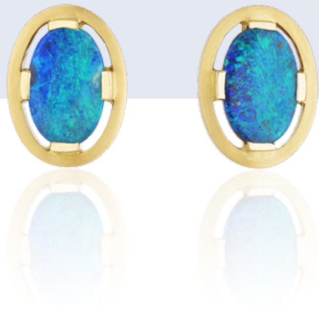
OHRSCHMUCK 750 Gelbgold | Boulder-Opale 4,70 Carat total