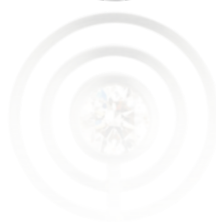
RING Platin | Diamant-Baguettes 2,82 Carat total RING Platin | Brillant 1,02 Carat