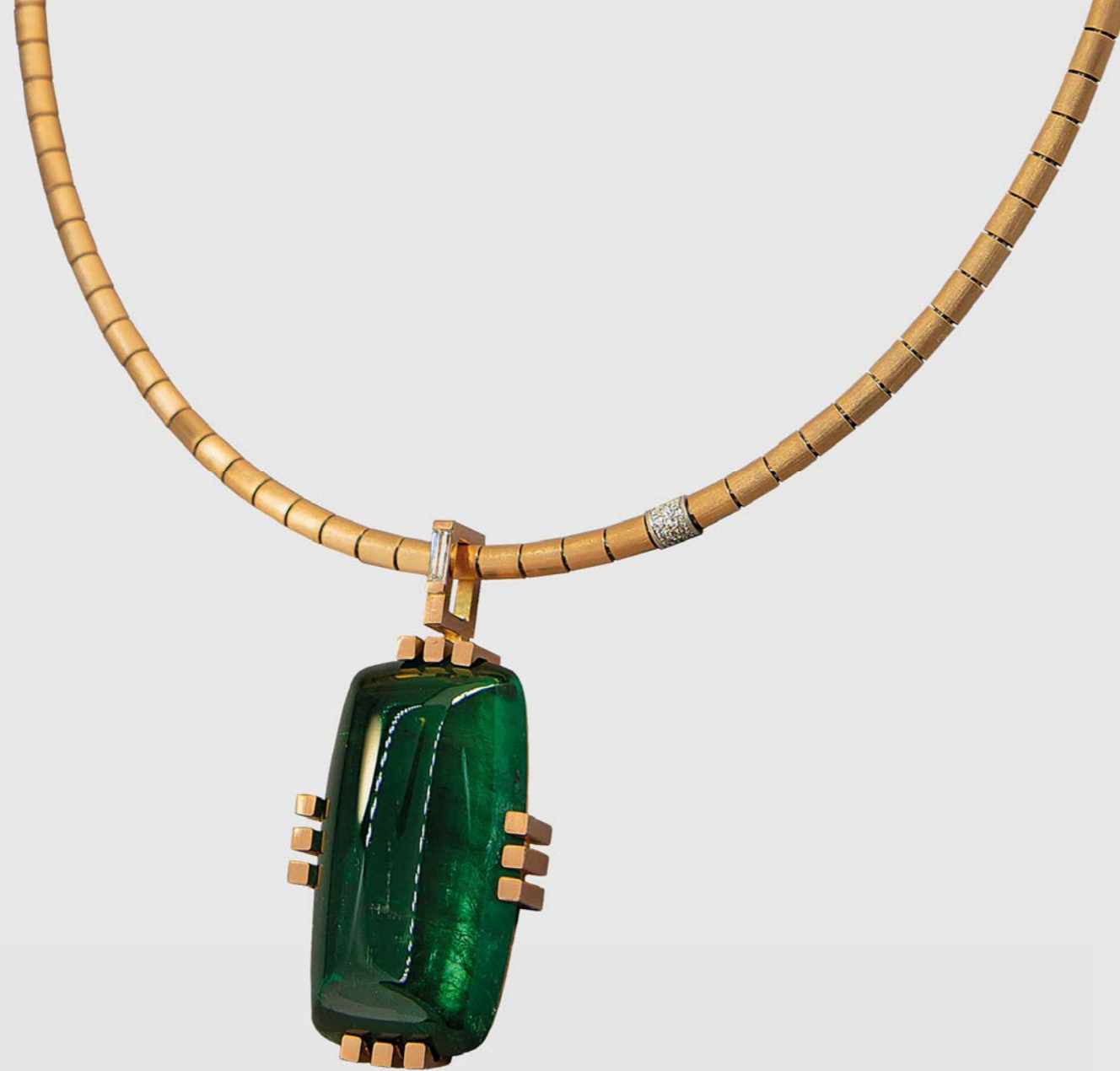
HALSSCHMUCK | 750 Rotgold | Turmalin nāboc hon 70,76 € at | Diamant