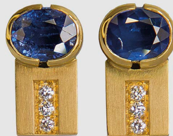
OHRSCHMUCK | 750 Gelbgold | 2 Saphire 2,66 Carat | Brillanten