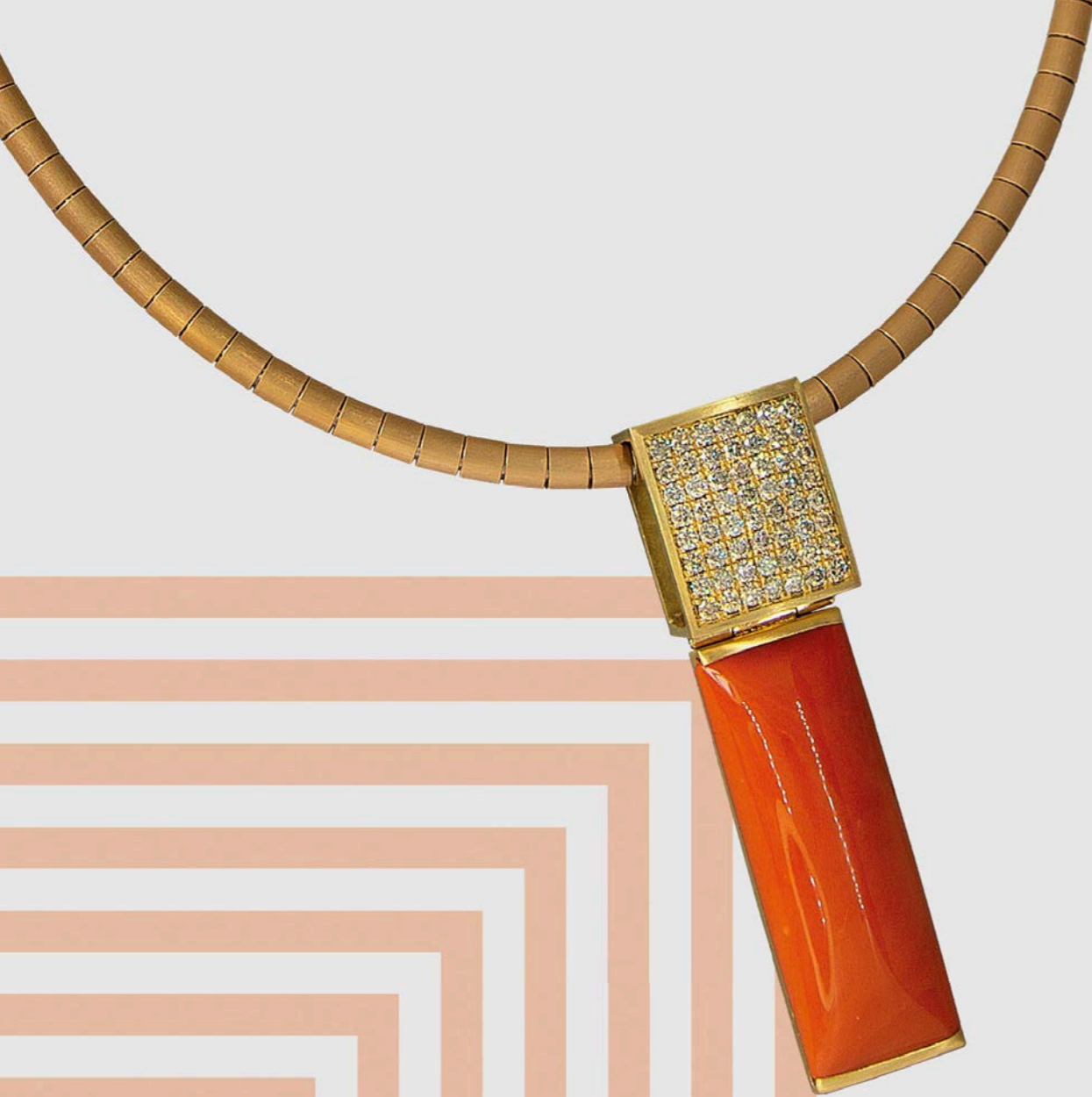
HALSSCHMUCK | 750 Gelbgold | Momok oralle | Brillanten 1,96 Carat