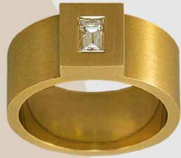
2 RINGE | 750 Gebgold | Diamant - r 0,2 carat | Brillanten 0,53 Carat RING | 750 Gebgold | Diamant-Baguette 0,25 Carat