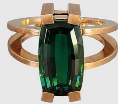
RING | 750 Rotgold | Turmalin 9,56 Carat RING | 750 Rotgold | Turmalin-Baguettes 8,11 Carat | Paraiba-Turmaline