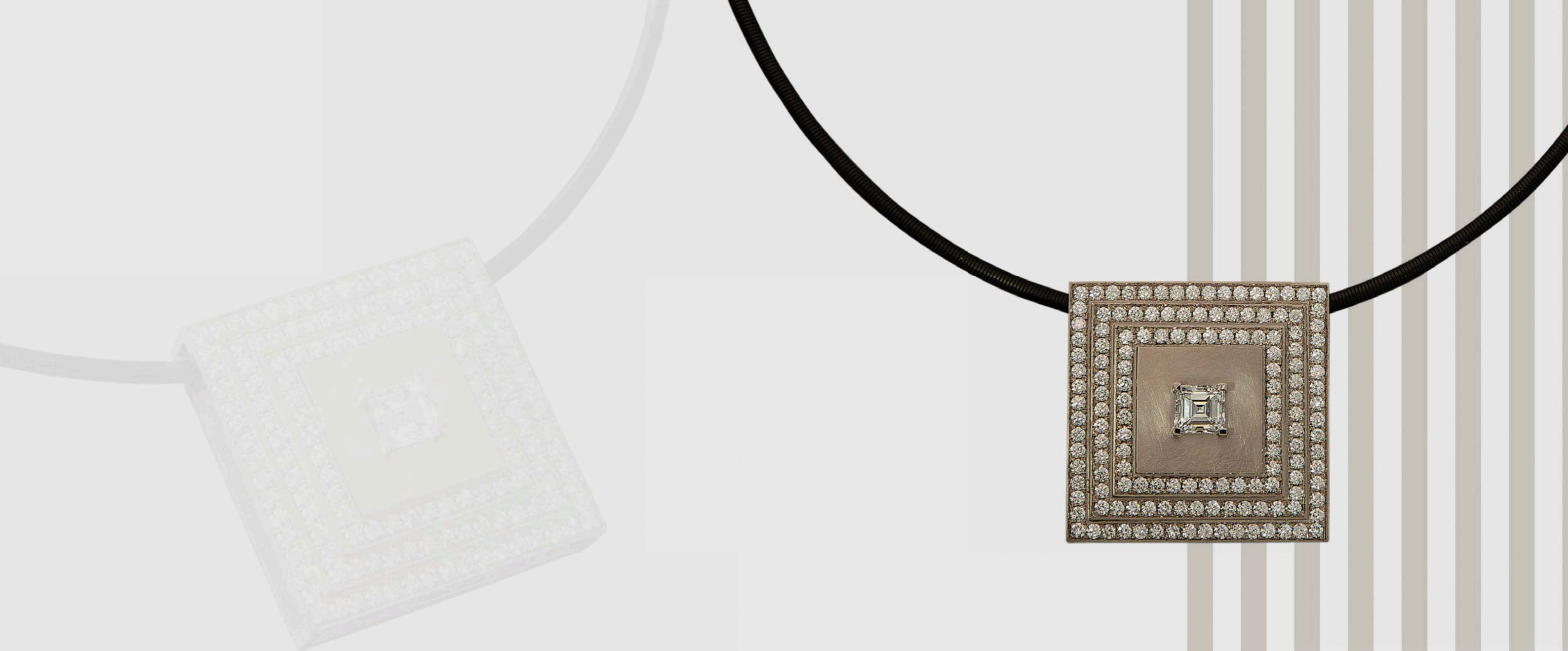
HALSSCHMUCK | 750 Weißgold | Diamant AsscherC ut 1,26 Carat | 144 Brillanten