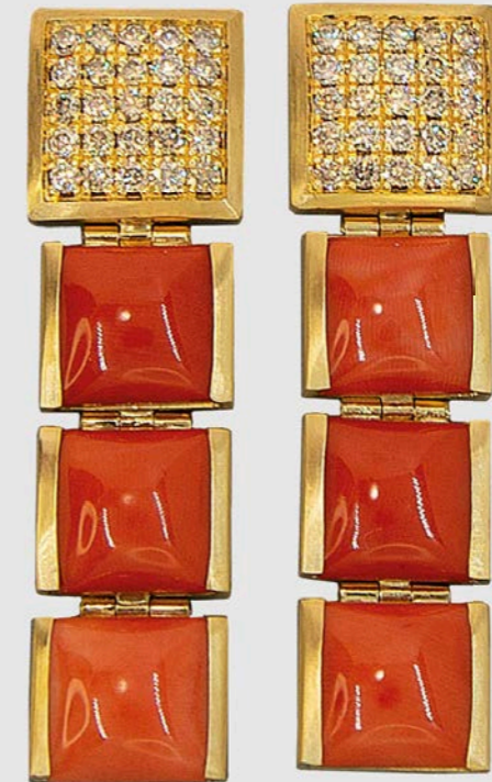
OHRSCHMUCK | Momok orallen | Brillanten 1,63 Carat