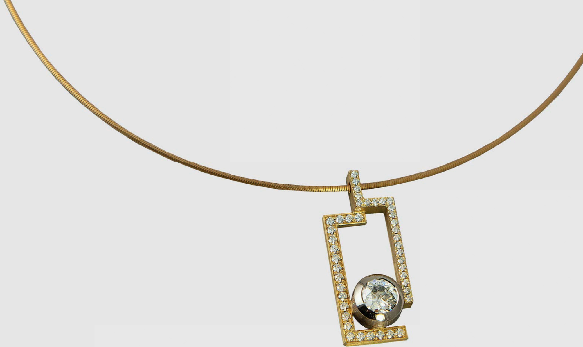
HALSSCHMUCK | 750 Rotgold | Brillanten 1,37 Carat | Brillanten