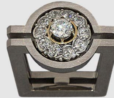
RING | 750 Weißgold | Brillant-Solitär 0,44 Carat | Brillanten RING | 750 Weißgold | Altschliff-Brillanten 0,85 Carat total