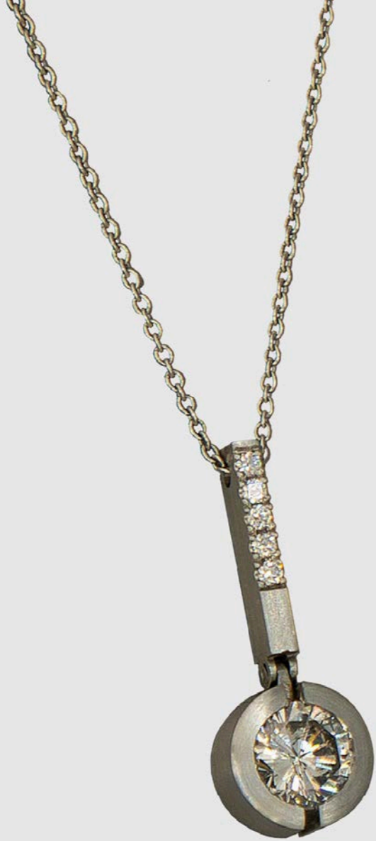
HALSSCHMUCK | 750 Weißgold | Brillant-Solitär 1,08 Carat | Brillanten