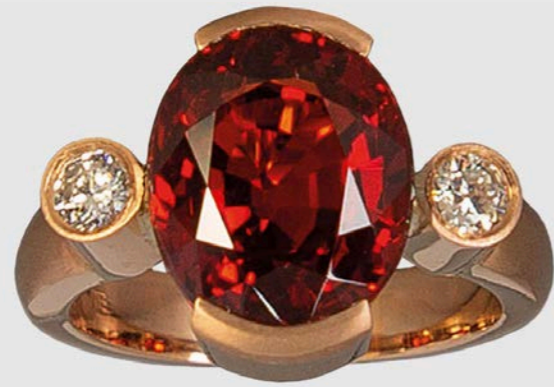
RING | 750 Rotgold | Mandarin-Granat 8,86 Carat | 2 Brillanten 0,24 Carat total