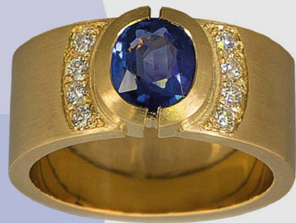
RING | 750 Gelbgold | Saphir 1,32 ct | Brillanten