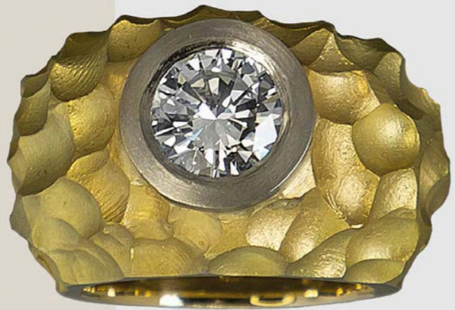
RING | 750 Geb- und Weißgold | Brillant-Solitär 1,78 Carat

Für weitere Informationen besuchen Sie unsere Webseite unter: