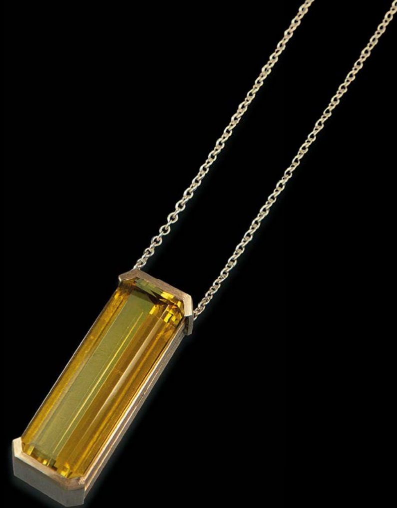
HALSSCHMUCK 750 Weißgold | Gelber Beryll 21,42 Carat