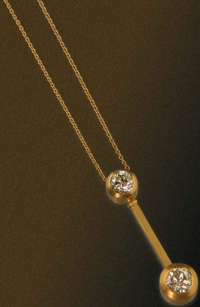
HALSSCHMUCK 750 Gelbgold | Brillant 1,06 Carat & Brillant 1,23 Carat