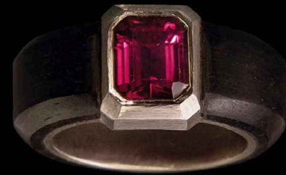
RING 750 Weißgold & Ebenholz | Rosa Turmalin 2,24 Carat