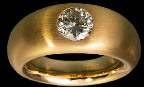
RINGE 750 Gelbgold | Brillant 1,04 Carat & Brillant 1,23 Carat