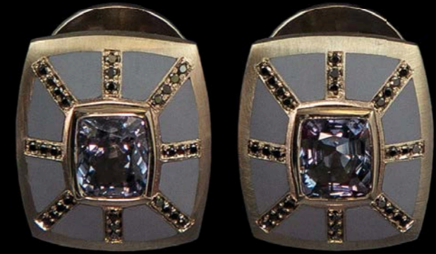
OHRSCHMUCK 750 Weißgold & Keramik | Blauer Spinell 3,20 Carat | Schwarze Brillanten