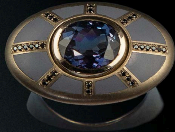
RING 750 Weißgold & Keramik | Blauer Spinell 3,93 Carat | Schwarze Brillanten