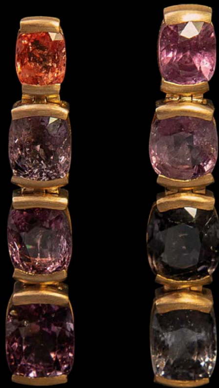
OHRSCHMUCK 750 Rotgold | 8 Spinelle 21,41 Carat total