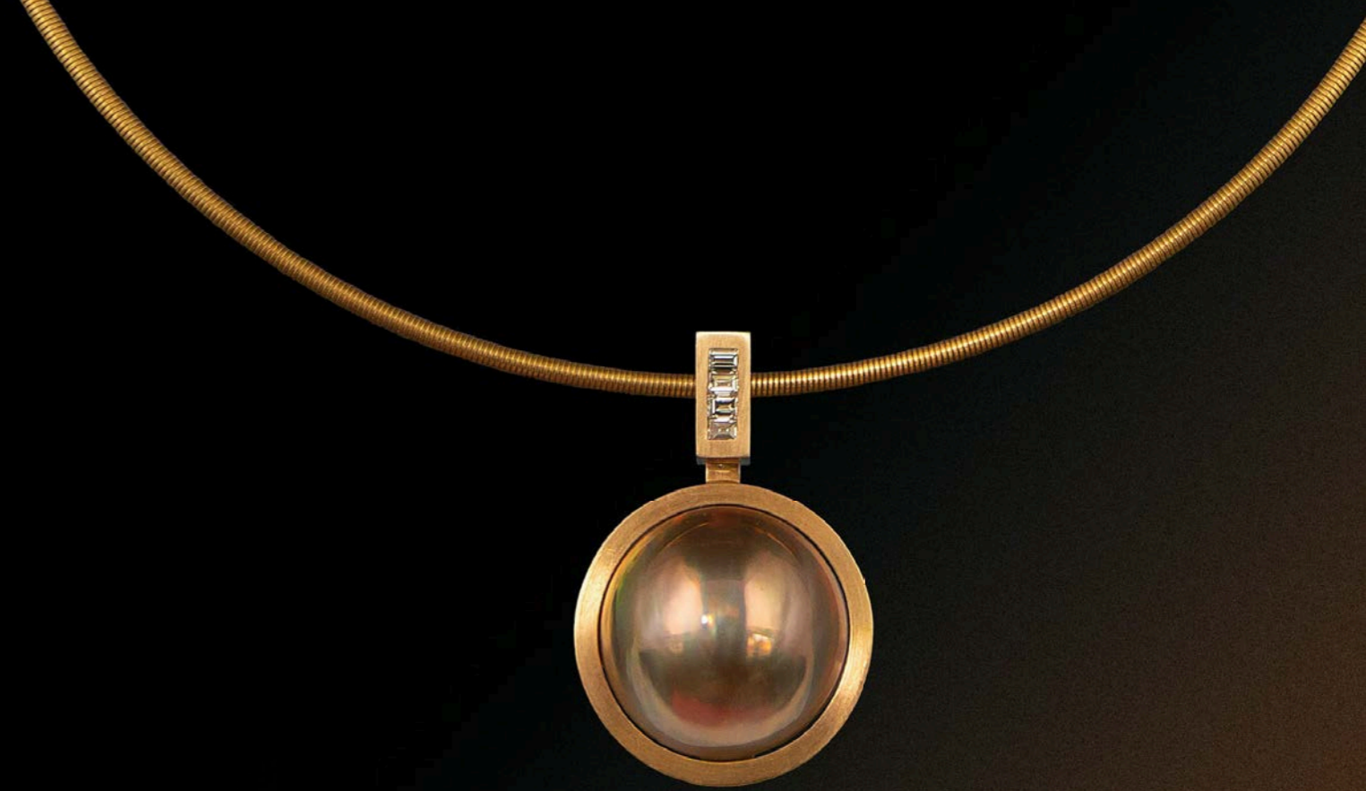
HALSSCHMUCK 750 Rotgold | MabeP erle Durchmesser 20,6 mm | Diamant-Baguettes 0,28 Carat