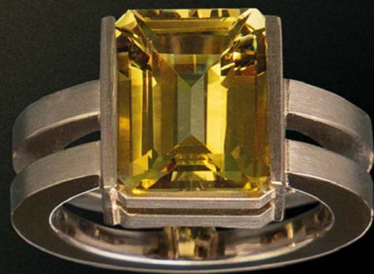
RING 750 Weißgold | Gelber Beryll 5,33 Carat