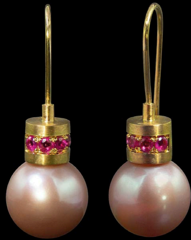
OHRSCHMUCK 750 Rotgold | SWP erle n Durchmesser 12,5 mm | Pink Sapphire 0,70 € rat