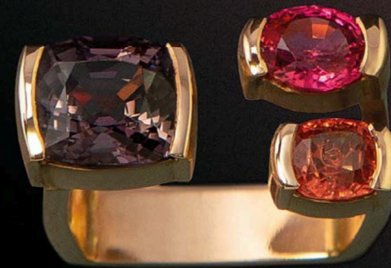
RING 750 Rotgold | 3 Spinelle 6,10 Carat total