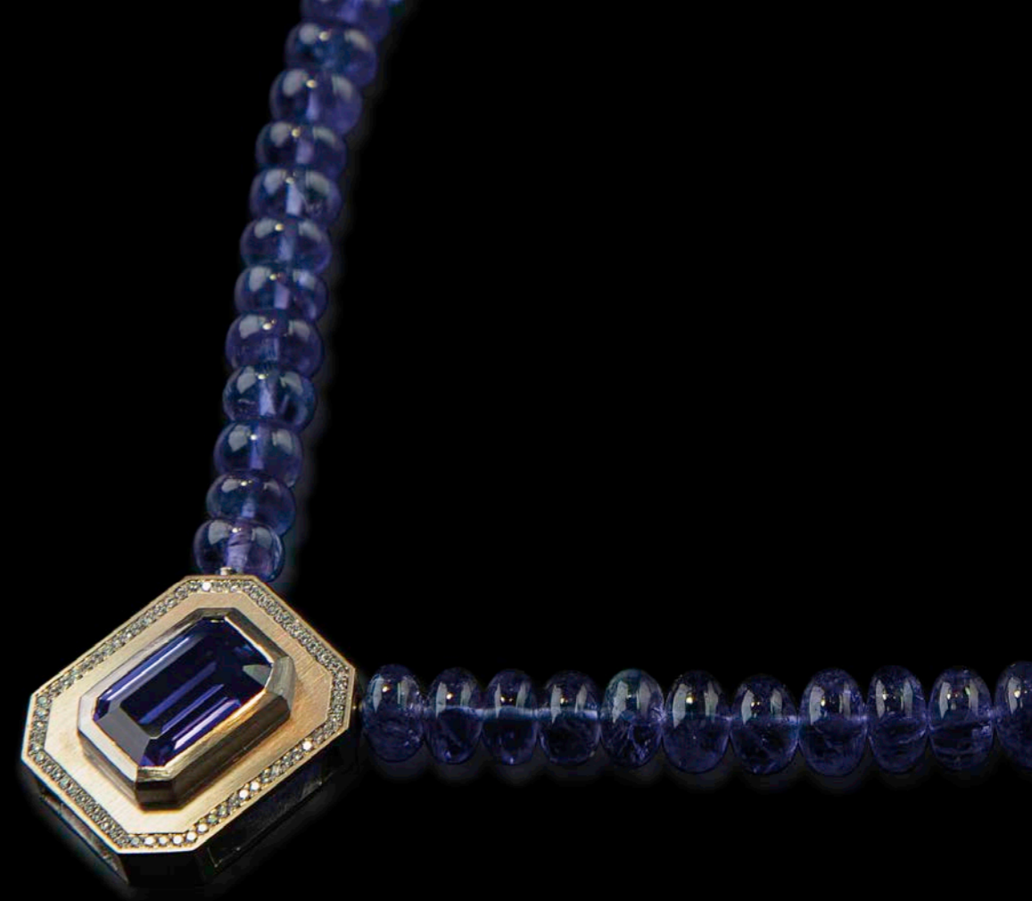
COLLIER 750 Weißgold | Tanzanit-Linsen mit Wechselschließe | Tanzanit 8,79 ct | 73 Brillanten 0,33 ct