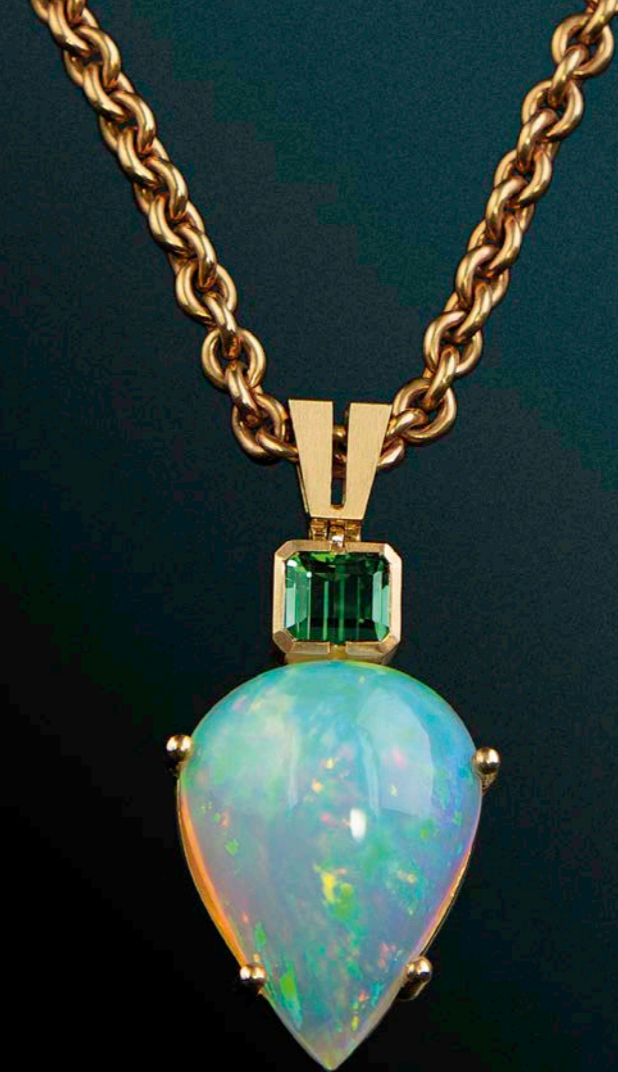
HALSSCHMUCK 750 Roségold | Opal 31,73 ct | Turmalin 2,27 ct