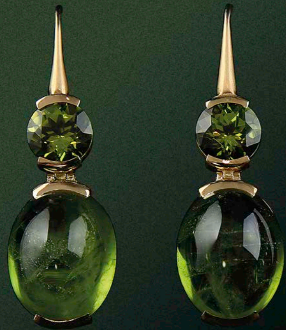
OHRSCHMUCK 750 Gelbgold | 2 Peridots Cabouchons 52,45 ct | 2 Peridots rd. 5,90 ct RING 750 Gelbgold | Peridot 8,01 ct | 2 Diamant-Baguettes 0,41 ct