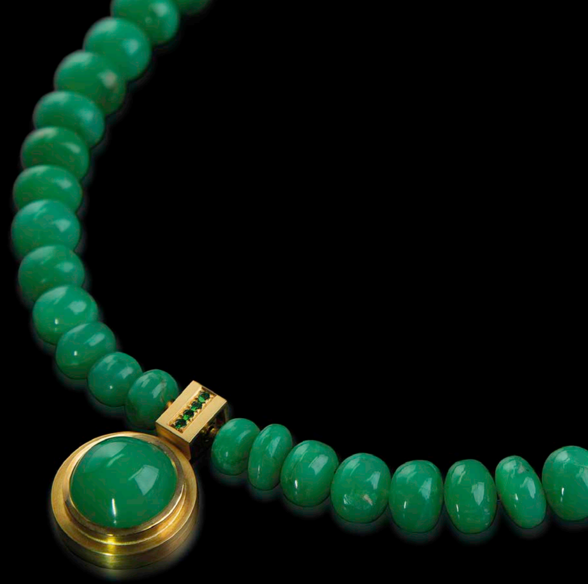
COLLIER 750 Gelbgold WechselschlieÙe | Chrysopras-Linsen | Chrysopras-Cabouchon 12,85 ct | 4 Tsavorite 0,16 ct