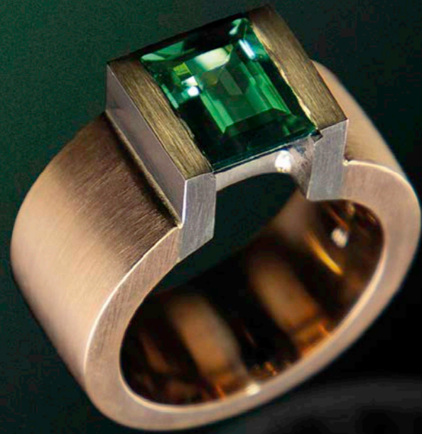
RING 750 Weiß- und Rotgold | Turmalin-Baguette 2,52 ct

Für weitere Informationen besuchen Sie unserer Webseite unter: