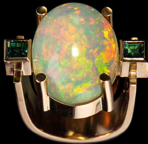
RING 750 Roségold | Opal 17,48 ct | 2 Turmalin-Carrées 0,72 ct