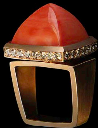
RING 750 Rotgold | Momo-Korall-Carrée 20,50 ct | 24 Brillanten 1,44 ct OHRSCHMUCK 750 Rotgold | Momo-Korall-Schoten | 14 Brillanten 0,90 ct