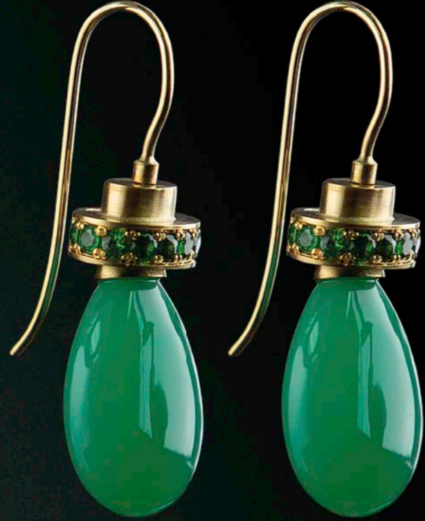
OHRSCHMUCK 750 Gelbgold | Chrysopras-Pampeln 32,91 ct | 14 Tsavorite 1,15 ct