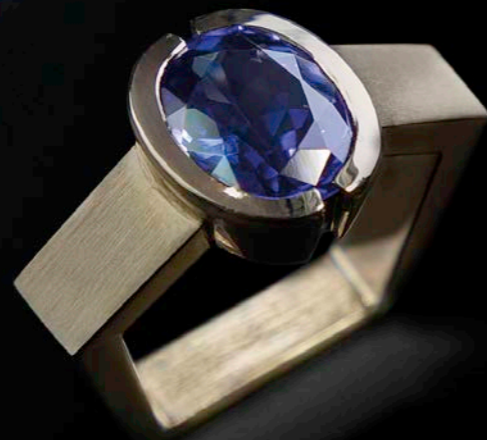
RING 750 Weißgold | Saphir-Carrée 3,01 ct | 2 Diamant-Baguettes 0,71 ct RING 750 Weißgold | Tanzanit 4,35 ct