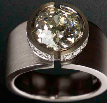
RING 750 Weißgold | Altschliff-Brillant 3,34 ct | 16 Brillanten 0,48 ct