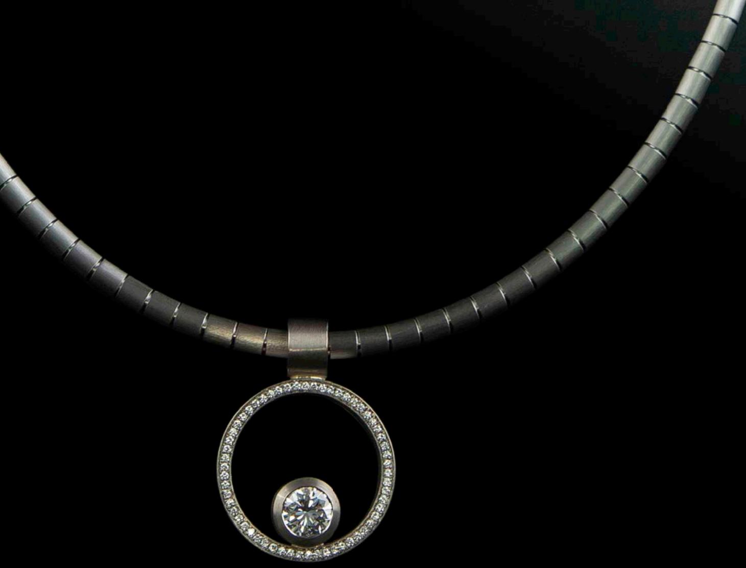
ANHÄNGER & HALSREIF 750 Weißgold | Brillant 1,07 ct | 58 Brillanten 0,26 ct