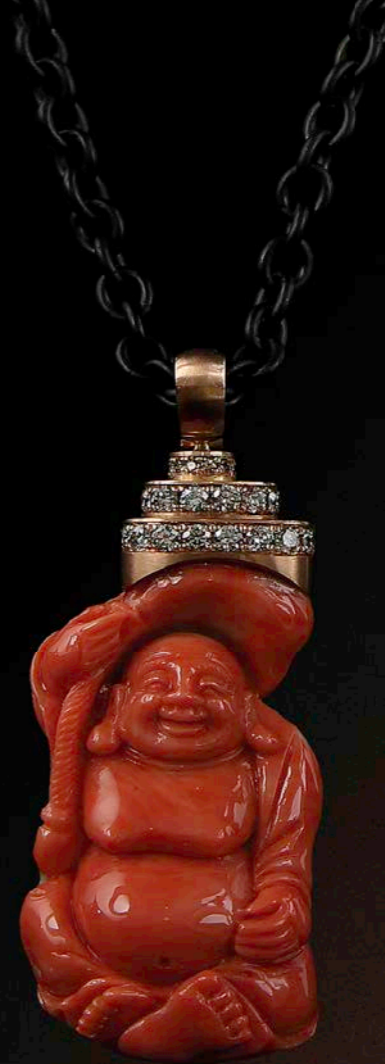
HALSSCHMUCK 750 Rotgold | Momo-Korall-Buddha | 26 Brillanten 0,77 ct | Kette DLC-beschichtet schwarz