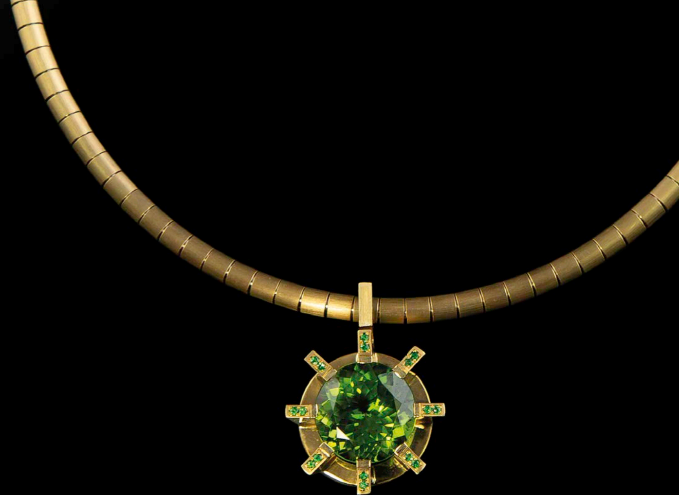
ANHÄNGER & HALSREIF 750 Gelbgold | Peridot 14,95 ct | 16 Tsaveorite 0,18 ct